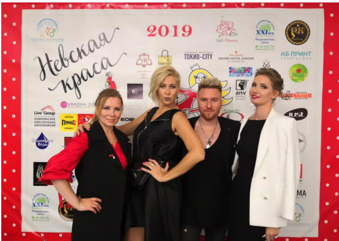
Упоминания в рекламных роликах и презентационных материалах Конкурса